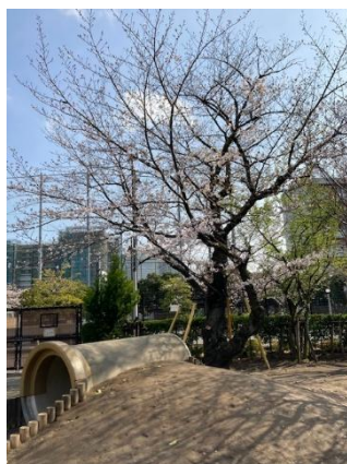
園庭のサクラの木

これから、サクラの花びらが舞う中、子どもたちの元気な声が幼稚園に響き、幼稚園は賑やかになることでしょう。新しいスタートは、わくわく感もあり、ドキドキ感もあります。楽しいけれど、疲れやすいので、規則正しい生活を心がけ、子どもたちが新しい生活に慣れていけるようにしていきたいです。今年度も子どもたちの豊かな成長のために、今年度も、港南幼稚園の教育活動へのご理解、ご協力を賜りますよう、よろしくお願いいたします。