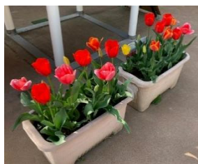
チューリップもきれいに咲きました。